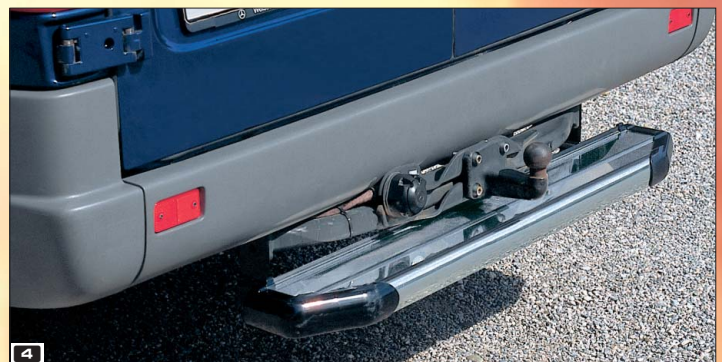
4 Rear step Heckauftritt Stainless steel / Edelstahl 150 4038 Fitting 3550 mm + 4025 mm wheel base only Nur für 3550 mm + 4025 Radstand