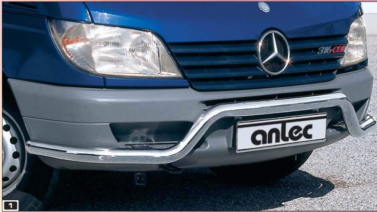
1 Spoiler protection pipe (shaped) Spoilerschutzrohr gekröpft Stainless steel / Edelstahl 150 4117