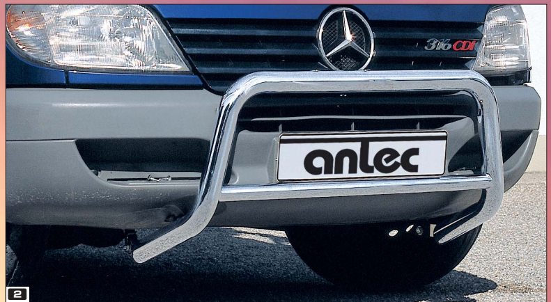
2 Brushguard Bully 60 low Frontschutzbügel Bully 60 niedrig Stainless steel / Edelstahl 150 4011