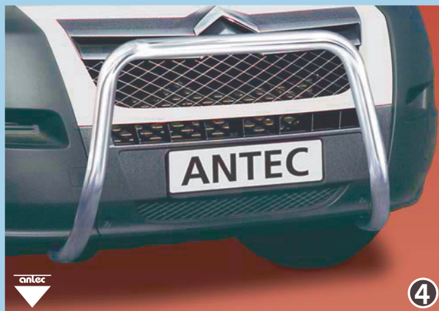
EU-pedestrian protection guard 60mm (also fitting with 10W4014) EU-henkilöturvakaari 60mm Peut également être monté avec 10W4014 Stainless steel / jaloteräs