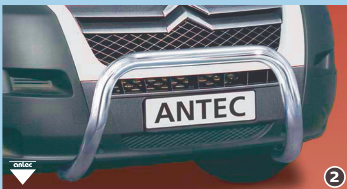
EU-pedestrian protection guard 76mm low (also fitting with 10W4014) EU-henkilöturvakaari 76mm matala Peut également être monté avec 10W4014 Stainless steel / jaloteräs