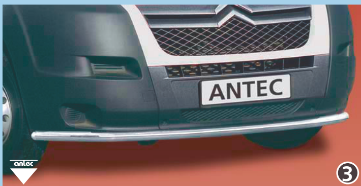
EU-spoiler protection pipe 60mm (not fitting with 10W4014 or EU-pedestrian protection guards) EU-Spoilerisuoja putkitaivutettu 60mm ei voi asentaa 10W4014 oder 10W4013 / 10W4113 / 10W4213:n kanssa Stainless steel / jaloteräs