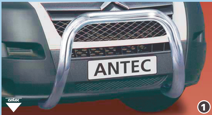
EU-pedestrian protection guard 76mm (also fitting with 10W4014) EU-henkilöturvakaari 76mm Peut également être monté avec 10W4014) Stainless steel / jaloteräs