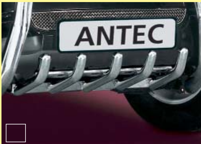
EU Underride Protection only mountable with 1714013 / 1714113

EU bescherming voor onderbouw, EU-certificate is valid with and article only mountable with 1714013 or 1714113