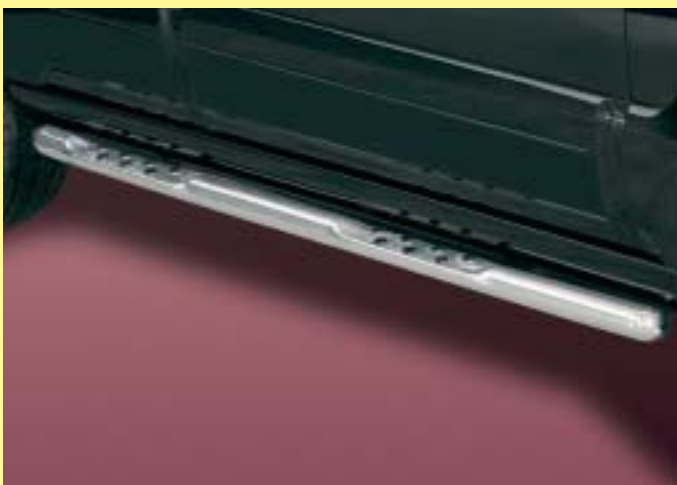
Side bar 60mm with step and dots Flankbeveiligingsbuis met opstapje voorzien van antislipnoppen 60 mm Stainless steel/ Edellaal 171 4251