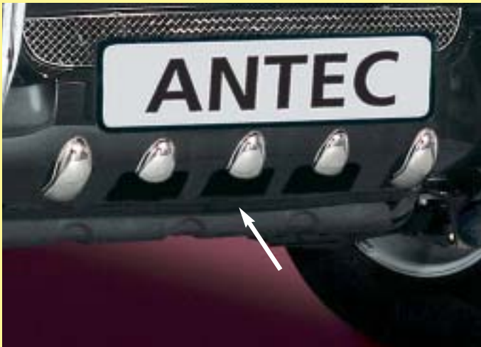
Blends for front underride protection Bescherming voor onderbouw biezen vooraan Stainless steel/ Edellaal 171 4314