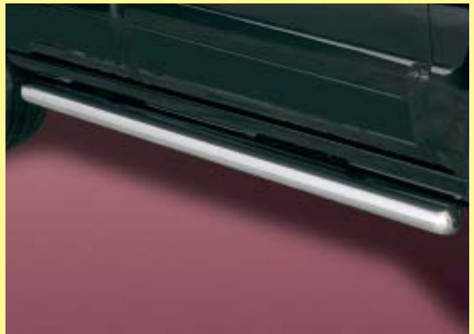
Side bar 60mm Flankbeveiligingsbuis 60mm Stainless steel/ Edellaal 171 4051