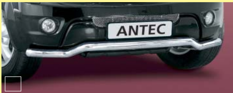
EU Spoiler Protection shaped 60mm