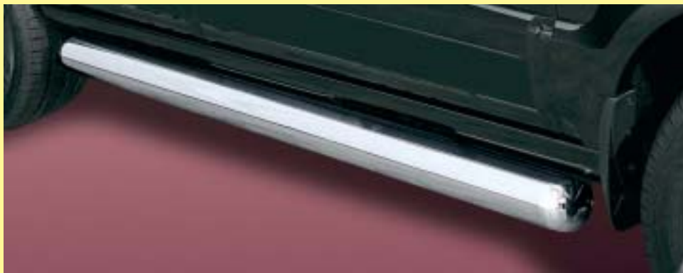
Side bar 76mm Flankbeveiligingsbuis 76mm Stainless steel/ Edellaal 171 4151