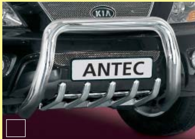
EU Pedestrian Protection Guard 70mm only mountable with 1714114

EU-veiligheidsbeugel voor personen 60 mm, EU-certificate is valid in combination with 1714114 only