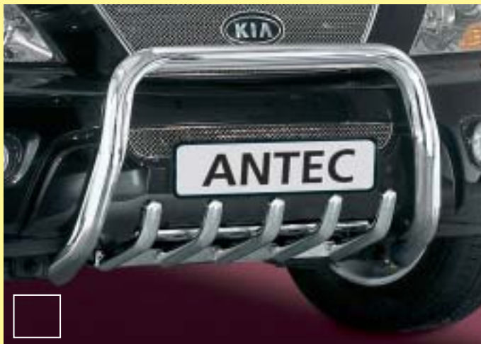
EU Pedestrian Protection Guard 60mm only mountable with 1714114

EU-veiligheidsbeugel voor personen 60 m, EU-certificate is valid in combination with 1714114 only