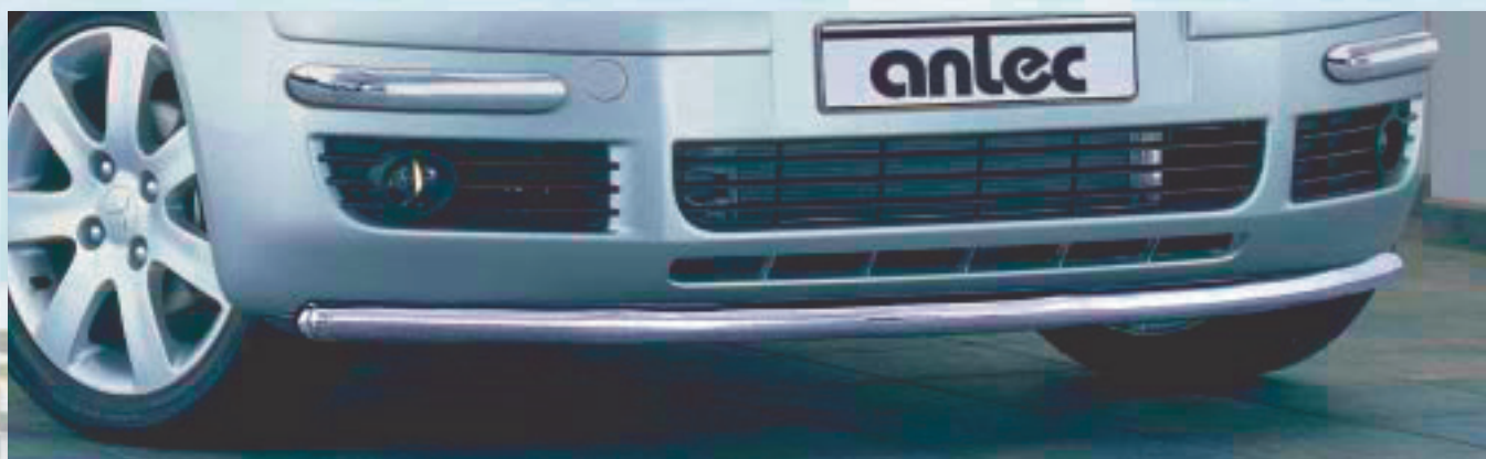
Spoiler protection pipe (straight) Spoilerskyddsstång fram (raksträcka) Stainless steel/Rostfritt stål 189 4116