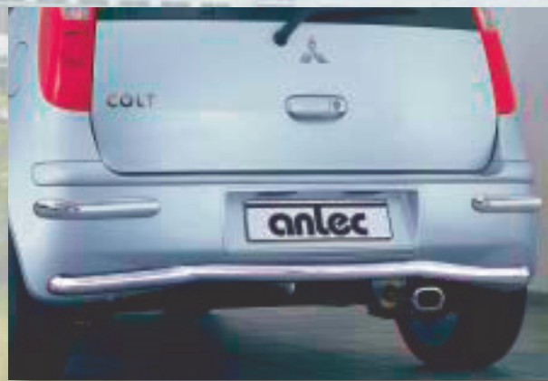
Rear bumper straight Stötfångare, bak (raksträcka) Stainless steel/Rostfritt stål 189 4038