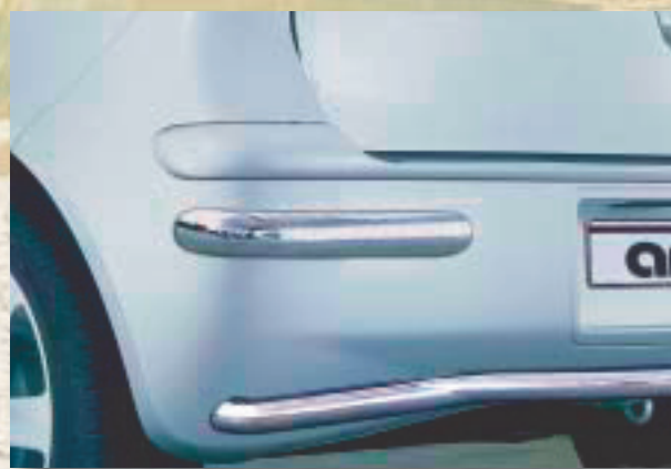
Styling rear bumper protector Stötfångarskydd bak "Bananas" Stainless steel/Rostfritt stål 189 4082