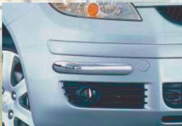
Styling front bumper protector Stötfångarskydd fram "Bananas" Stainless steel/Rostfritt stål 189 4081