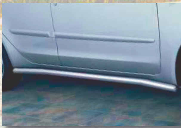
Side bar (5-door) Sidoskyddsstång (5-dörr.) Stainless steel/Rostfritt stål 189 4051