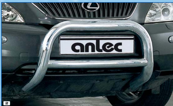
2 Brushguard Bully 76 mm rura przednia Bully 76 Stainless steel / stal szlachetna 180 4211