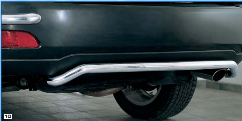
10 Rear bumper shaped zderzak tylny wygięte Stainless steel / stal szlachetna 180 4037