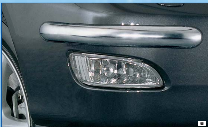
6 Styling front bumper protector osłona przedniego zderzaka Stainless steel / stal szlachetna 180 4081