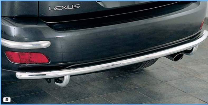
9 Rear bumper long zderzak tylny długi Stainless steel / stal szlachetna 180 4038