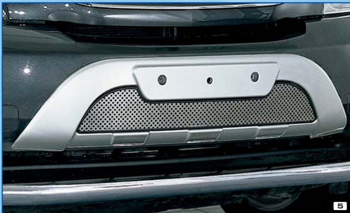
5 Synthetic Frontguard osłona przodu z tworzywa PU/Kunststoff