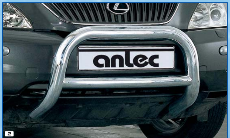
2 Brushguard Bully 76 mm Frontschutzbügel Bully 76 mm Stainless steel / Edelstahl 180 4211