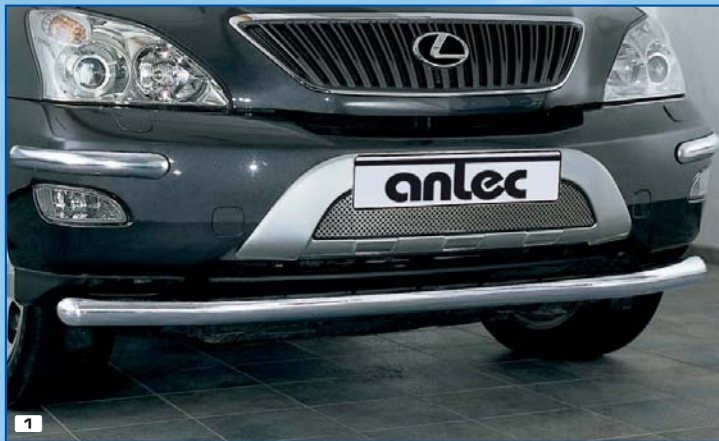
1 Spoiler protection straight Spoilervédő cső elől (egyenes) Stainless steel / fényesített inox acél 180 4116