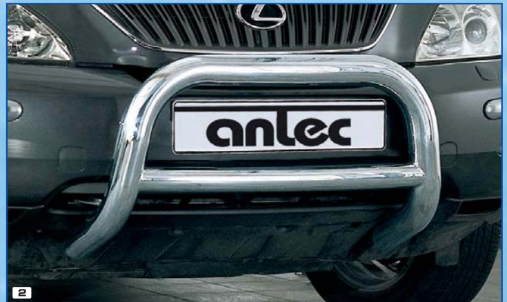
2 Brushguard Bully 76 mm Barre frontale de protection Bully 76 Stainless steel / Acier inoxydable 180 4211