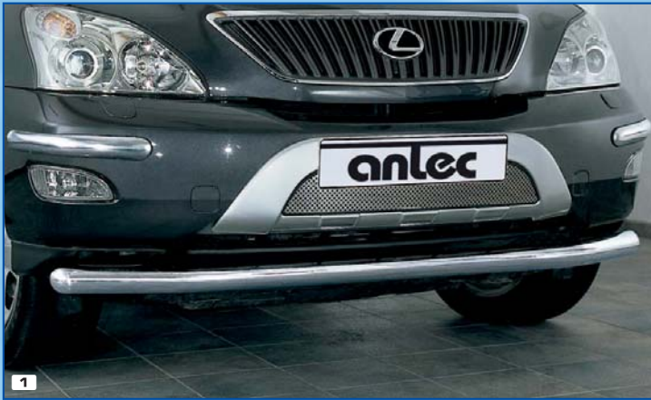
1 Spoiler protection straight Tube de protection du spoiler avant (droit) Stainless steel / Acier inoxydable 180 4116