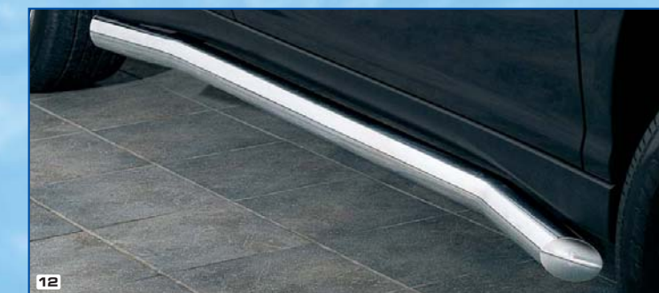
12 Side bar shaped Flankenschutzrohr gebogen Stainless steel / Edelstahl 180 4151