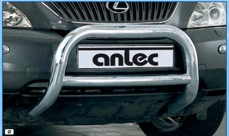
2 Brushguard Bully 76 mm Frontschutzbügel Bully 76 mm Stainless steel / Edelstahl 180 4211