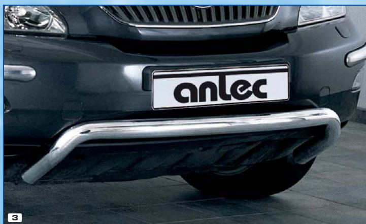
3 Spoiler protection shaped ochranná trubka na spoiler vpředu ohnuté Stainless steel / nerezová ocel 180 4117