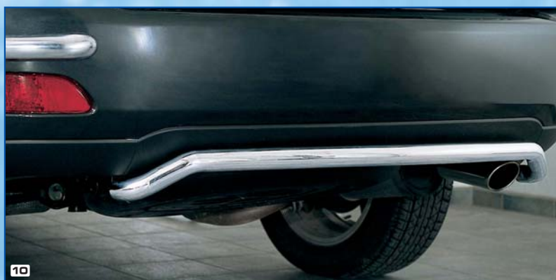
10 Rear bumper shaped zadní narazník ohnuté Stainless steel / nerezová ocel 180 4037