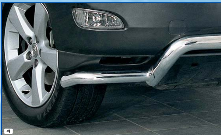
4 Spoiler protection edge (mountable with 180 4117) ochranný roh na spoiler možno namontovat s 180 4117 Stainless steel / nerezová ocel 180 4115