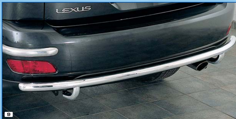
9 Rear bumper long zadní narazník dlouhý Stainless steel / nerezová ocel 180 4038