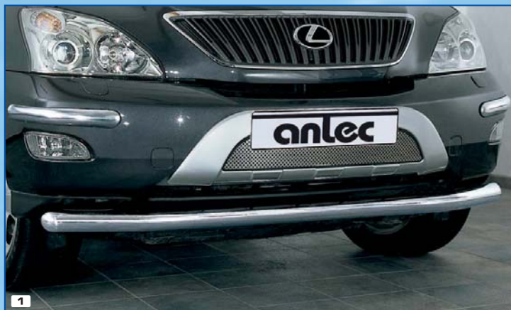
1 Spoiler protection straight ochranná trubka na spoiler vpředu (rovni) Stainless steel / nerezová ocel 180 4116