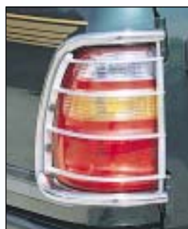
10 Rear light protection grille zadní rourový rám s mřížkou na světlotety