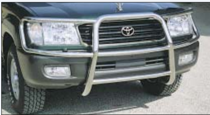
Brushguard RS 60 ① prední ochranný rám RS 60