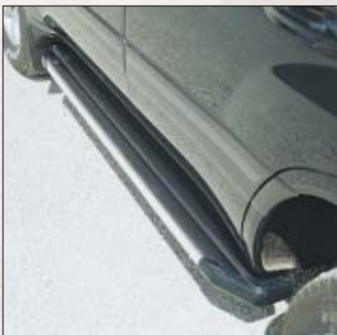
12 Sideboard Step 3 stupacka Step 3