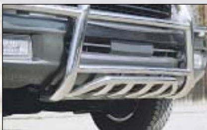
⑥ Front underride protection spodní ochrana vpredu