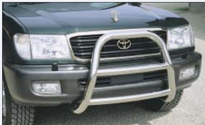
② Brushguard Bully 70 prední ochranný rám Bully 70