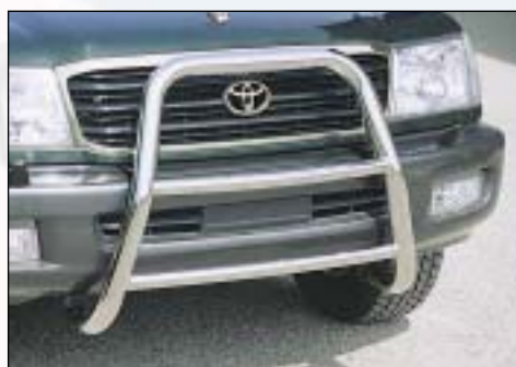
5 Brushguard Bully 60 přední ochranný rám Bully 60