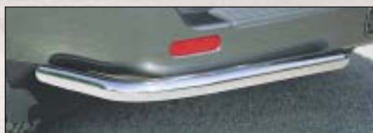
11 Rear bumper zadní ochrana