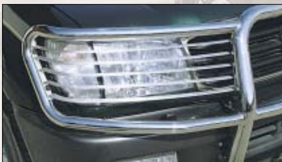
⑦ Front light protection grille ochranní mřížka na světlo vpredu