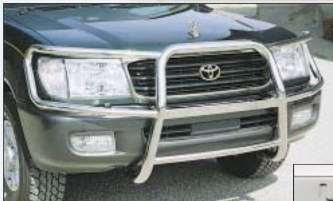
③ Brushguard RS 60U prední ochranný rám RS 60U