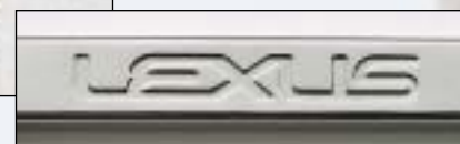
④ „LEXUS“ emboss ražením názvu LEXUS