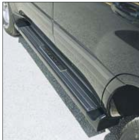
Blind for Sideboard 9 nástupní kryt

Sideboard Step 1 /stupacka Step 1 Alu black /hliník černý 1405070