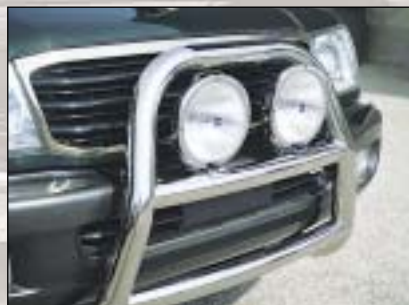
⑧ Support for additional head lights upevnění na dodatečné světlo