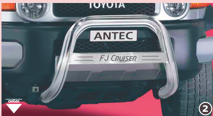
EU-pedestrian protection guard 76mm with integrated horizontal profile "FJ CRUISER" EU-suojakaari 76mm integroidulla poikkiprofiililla "FJ CRUISER" Stainless steel /jaloteräs 12L 4013