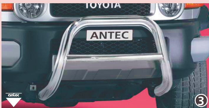
EU-pedestrian protection guard 70mm with integrated horizontal pipe 51mm EU-turvakaari 70mm integroidulla poikkiputkella 51mm Stainless steel /jaloteräs 12L 4113