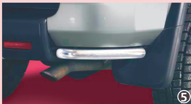
Bumper protection rear 42mm (compatible with tow-bar) peräkulmasuojus 42 mm, yhteensopiva perävaunukytkimellä Stainless steel /jaloteräs 12L 4033