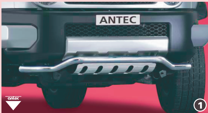
EU-spoiler protection pipe 51mm cranked incl. EU-underride protection plate EU-spoilerisuoja putki edessä ( aukkoinena) alleajoeste 51mm Stainless steel /jaloteräs 12L 4017