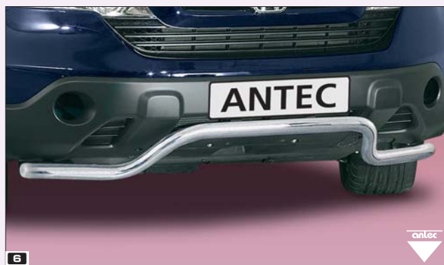
6 EU-spoiler protection pipe 51mm cranked UE-rura ochronna spoilera zalamane 51mm Stainless steel / stal szlachetna 11V 4017