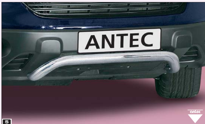
5 EU-spoiler protection pipe 60mm (middle) UE-Rura ochronna na spoiler, wygieta 60mm (Mitte) Stainless steel / stal szlachetna 11V 4016