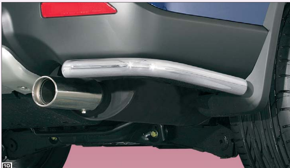
10 Rear bumper protection 42mm single pipe (also mountable with tow-bar) oslona tylnych narozy z pojedynczej rury 42 mm (auch montierbar mit Anhängerkupplung) Stainless steel / stal szlachetna