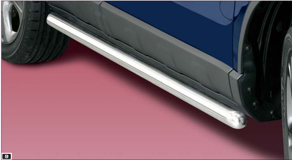
9 Side bar 60mm straight rura ochronna boczna (straight) 60 mm Stainless steel / stal szlachetna