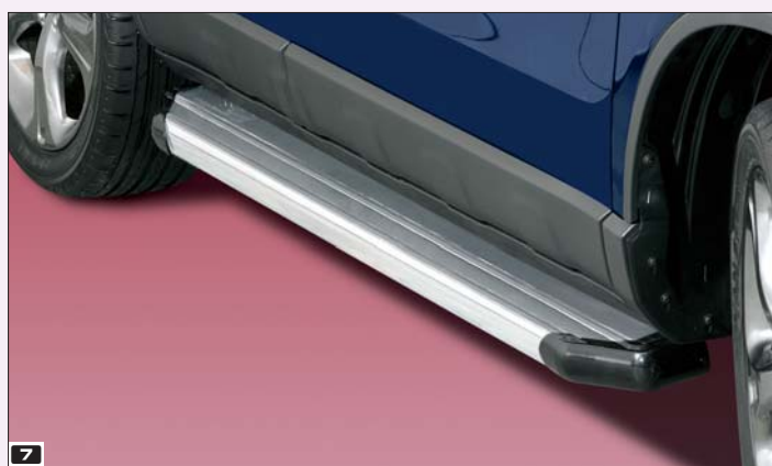
7 Side step 3 Stopień Step 3 Aluminium / Aluminium 11V 4071