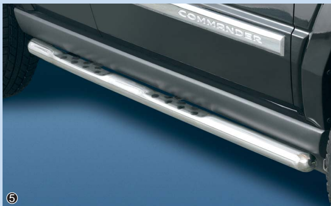
⑤ Side bar 60mm with Step and Dots Flankenschutzrohr 60mm mit Auftritt und Antirutschnoppen Stainless steel / Edelstahl 11D 4051