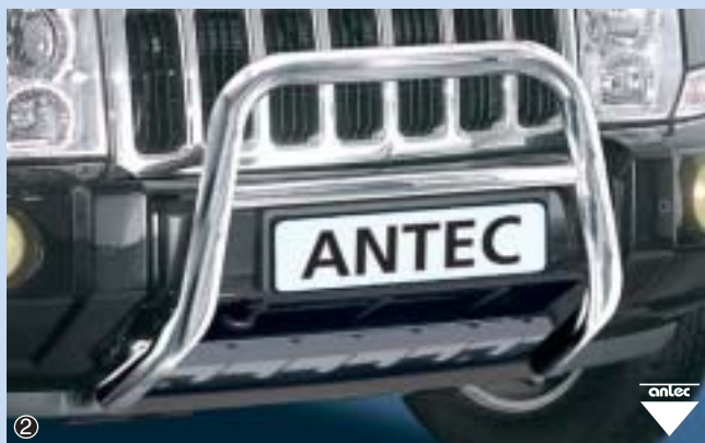
② EU Pedestrian Protection Guard 60mm high

Stainless steel / stal szlachetna 11D 4013