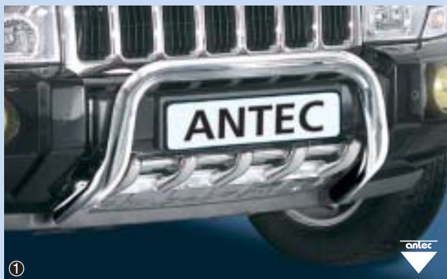
① EU Pedestrian Protection Guard 60mm low without Underride protection

UE rura przednia chroniaca pieszych 60 mm nisko brak zabezpieczenie podwozia przed najechaniem – przód