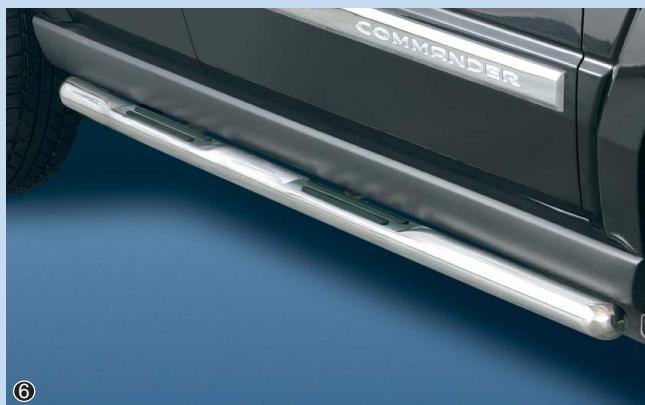
⑥ Side bar 60mm with Step and Profil Flankenschutzrohr 60mm mit Auftritt und Antirutschprofil Stainless steel / Edelstahl 11D 4251