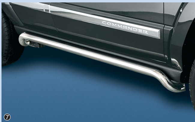
⑦ Side bar shaped 60mm Flankenschutzrohr gebogen 60mm Stainless steel / Edelstahl 11D 4151