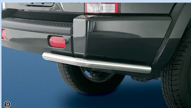
⑨ Rear bumper 51mm Heckeckenschutz 51mm Stainless steel / Edelstahl 11D 4034