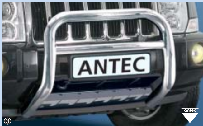
③ EU Pedestrian Protection Guard 70mm high

Stainless steel / stal szlachetna 11D 4113