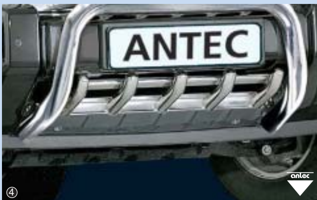
④ EU Underride protection (Pipe 42mm)

Stainless steel / stal szlachetna 11D 4313